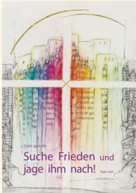
Jahreslosung im Verlag am Birnbach Motiv von Stefanie Bahlinger, Mössingen

Es könnte auch sein, dass dein Friede mit Gott gestört ist. Finde dich nicht ab mit diesem Zustand! Gib dich damit